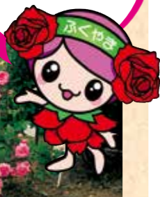
地域花壇「遺芳ばら園」

福山市内にはいたるところに“ばら”が植えられています。地域や学校のばら花壇は、地域の人たちや児童・生徒のみなさんの努力で、きれいな“ばら”の花を咲かせています。