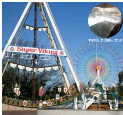
神勝寺温泉昭和の湯

これまで一般の方には、非常に限られた形でしか触れる機 会のなかった禅の広大な世界を、五感を解放してお楽しみ ください。🌿不定休 ☎084-988-1111(寺務所)