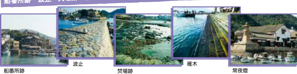
船番所跡 波止 焚場跡 雁木 常夜燈