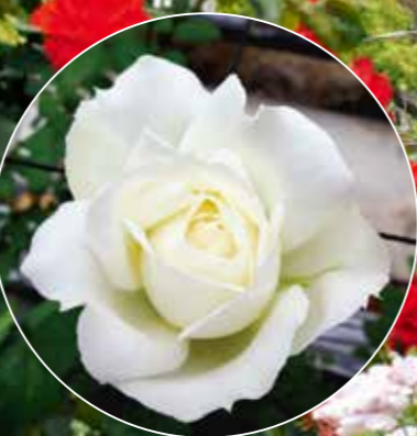
市制施行100周年記念ばら 「ローズマインドふくやま」