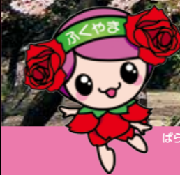
ばらのまち福山イメージキャラクター「ローラ」

福山駅から間近に見える福山市のシンボル。 福山城跡は国の史跡に、伏見櫓・筋鉄御門は共に国の重要文化財に指定されています。