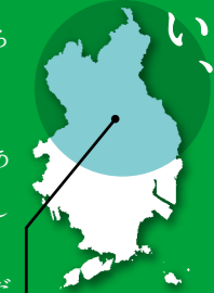
神辺・新市・芦田・駅家・山野・御幸エリア

江戸時代の面影を今に残すまち、神辺。可愛い動物たちに子どもたちの歓声が飛び交う福山市立動物園。緑のシャワーを浴びながら、アウトドアライフを満喫できる山野峡。訪れる人々を四季折々の表情でお迎えます。