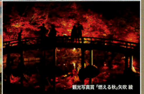
観光写真賞「燃える秋」矢吹 綾

観光写真コンテストは、観光資源の掘り起こしと観光PRを目的に、四季を通じた自然景観、行事・祭など福山市の魅力を盛り込んだ作品を募集しています。