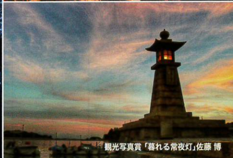
観光写真賞「暮れる常夜灯」佐藤 博