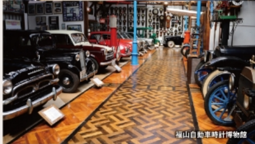
福山自動車時計博物館